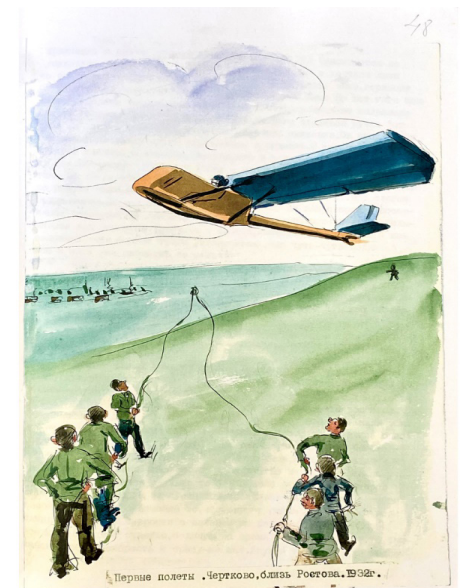
Первые полеты. Чертоково, близ Ростова, 1932г.

Но вернемся немного обратно. Вот воскресенье, 22 июня 1941 года. В шесть тридцать утра, я должен взлетать на своем П-5 на высоту с наблюдателем метеорологом. Все готово к полету. Но при ясной погоде, по звонку из Центральной Диспетчерской Службы полет вдруг запрещен. И не только мой – были отменены все вылеты. Только два полета по «санитарному заданию – воздушная скорая помощь» - были разрешены. Несколько техников и две женщины метеорологов лишь были в это раннее утро в отряде. Странная, непривычная тишина и тревожное чувство длилось не долго. Через полчаса мы все узнали. А вскоре, несмотря на выходной, почти весь личный состав отряда, собрался на воздухе, у вынесенного репродуктора. Состоялся импровизированный митинг. Так началась для меня эта Великая Война, в первое