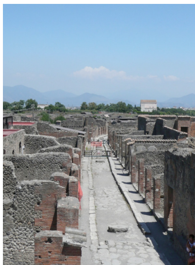
Vista actual de Via degli Augustali, Pompeya

La devastación patrimonial fue inmensa, hasta tal punto que tras el cese inmediato de las actuaciones militares, se reunió en Londres (noviembre 1945) la conferencia de Naciones Unidas con el fin de iniciar una política firme, unida y solidaria por el bien de la educación y la preservación patrimonial. Un año más tarde en 1946 se puso en funcionamiento uno de los puntos fundamentales acordados en dicha conferencia, la Organización de las Naciones Unidas para la Educación, la Ciencia y la Cultura (UNESCO).