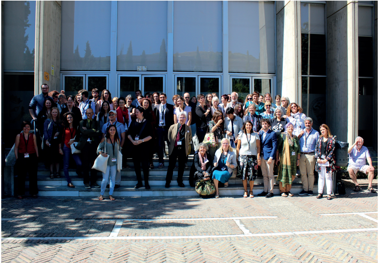
Participants of the VII Purpureae Vestes International Symposium on Textiles and Dyes in the Ancient Mediterranean World Granada, Spain 2-4 October 2019