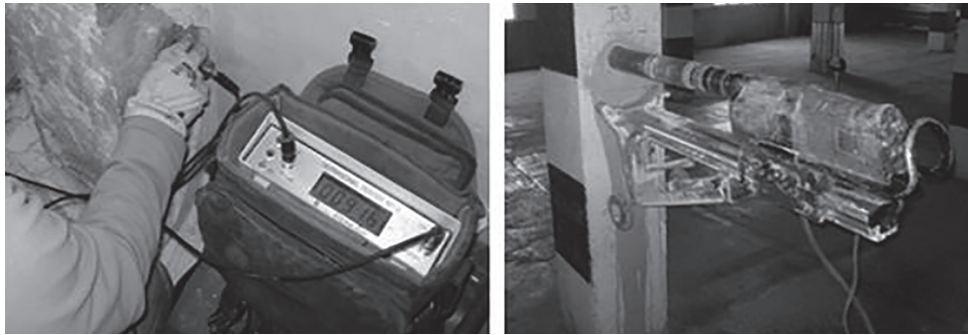
Figura 1. Proceso de análisis de ultrasonidos (izquierda). Momento de extracción de una probeta testigo (derecha).

De cara a discriminar el estudio, la localización de ultrasonidos y probetas testigo, se realizó por las obras analizadas, a lo largo de la geografía en la banda mediterránea. Por razones de espacio no se detalla la situación de cada una de las obras que quedan perfectamente identificadas en la correspondiente toma de datos, que es objeto de otra investigación paralela. Es importante señalar que cada uno de los valores de probetas testigo lleva asociado un valor único de velocidad de ultrasonidos.