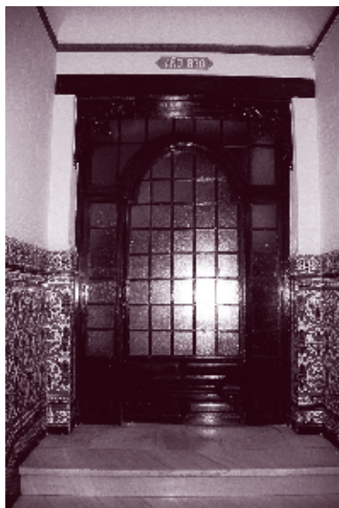
■ Foto 1.2. La entrada principal al inmueble situado en el número 81 de la Avda. de Calvo Sotelo reflejaba con claridad el año de su inauguración, 1930. Durante años el inmueble estuvo aislado, pero posteriormente se construyeron algunos edificios contiguos. (Colección NOS).