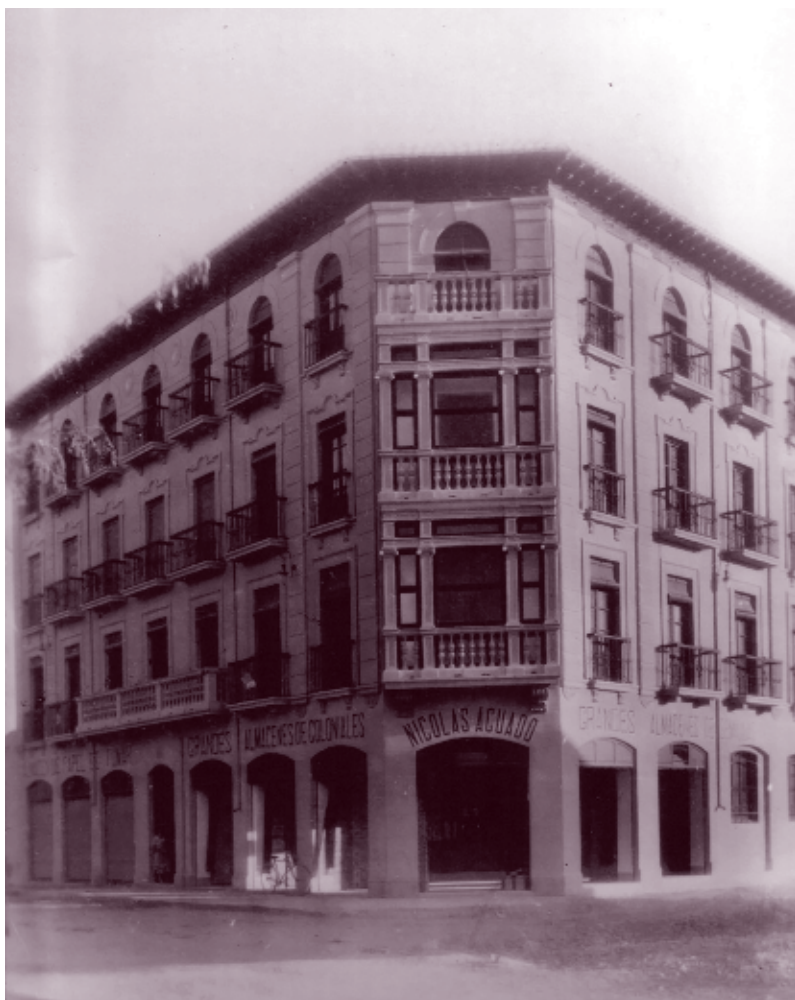
■ Foto 1.1. La foto muestra el inmueble de la actual Avda. de la Constitución 39 como lucía en 1930, año de su inauguración. Sin haber modificado su emplazamiento el edificio fue cambiando su dirección al mismo ritmo que la calle cambiaba de nombre. Así, pasó de la Avenida de Alfonso XIII, en su fundación, a la Avda. de la República un año más tarde, de ahí a la Avda. de Calvo Sotelo y por último (¿seguro?) a la Avda. de la Constitución.