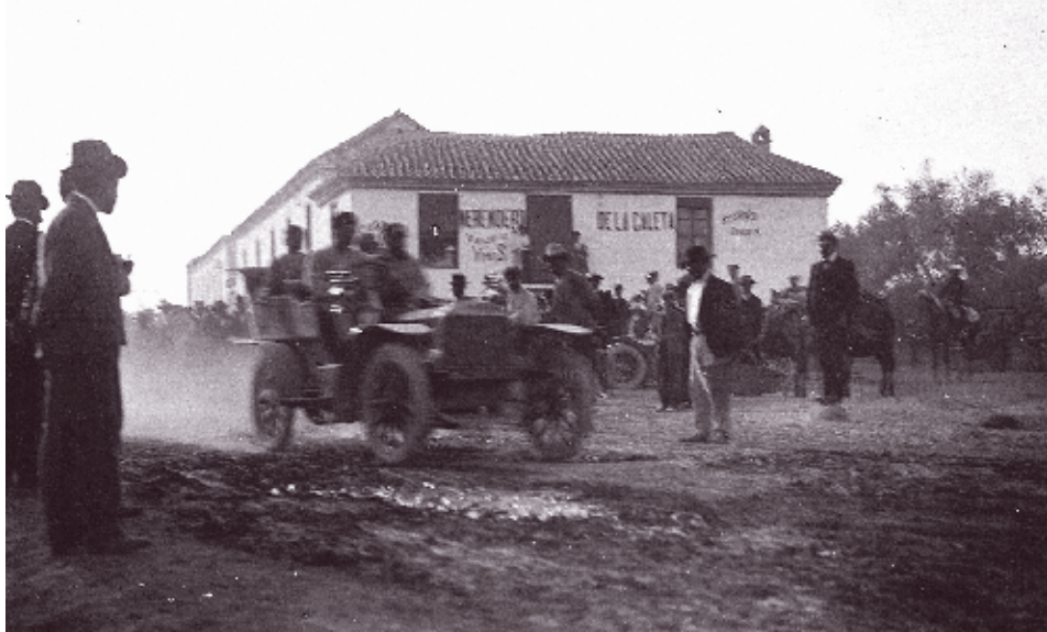
■ Foto 1.10. Esta será, quizás, la primera referencia visual de La Caleta. Con motivo de las fiestas del Corpus del año 1907 se organizaron carreras de automóviles. El fotógrafo tomó instantáneas en diferentes calles de la ciudad. En esta ocasión el Merendero de La Caleta aparece cerrando el plano. El edificio estaba aislado, en una encrucijada de caminos, tan solo acompañado por el Hospital de San Lázaro.

el de Ida y Vuelta, el de Vílchez, el de Zarabanda, el de la Siempreviva, el de las Latas, o las ventas de san Juan y de Luis XV o el mismísimo parador de las Campanas, entre otros muchos, en funcionamiento durante algunos años, en ocasiones coincidentes en el tiempo, pero que siempre han ido acompañando a los caminantes en su llegada a la ciudad de Granada.