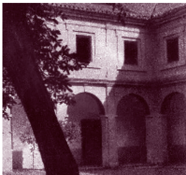
■ Foto 1.5. El hospital de san Lázaro, fundación del año 1497, ocupaba el solar del actual edificio de los Juzgados. (Colección NOS).