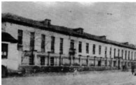
■ Foto 1.6. Inicialmente fue un lazareto y más tarde tuvo otros usos hospitalarios para tratamientos de enfermos infecto-contagiosos y residencia de desvalidos. (Colección NOS).

24 fue demolido en 1973 y algunas parecen custodiarse en san Juan de Letrán. A mí personalmente, cuando visitaba la capillita cogido fuertemente de la mano de mi madre, no me parecía tan poco meritoria, al contrario, me impresionaba el silencio y el olor a barniz y madera que desprendía; pero esto es adelantar acontecimientos.