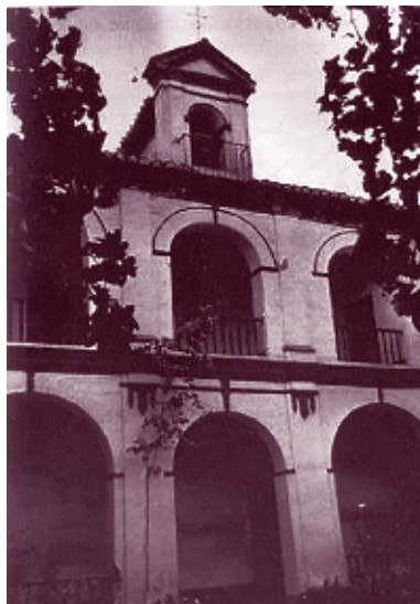
■ Foto 1.7. El hospital de san Lázaro contaba con una capilla y tres grandes patios construidos a lo largo del siglo XVII, además del original en torno a la capilla.

La ermita de san Juan de Letrán, nuestra segunda alternativa como lugar consagrado, fue fundada en 1692 por Alonso Bernardo de los Ríos y Guzmán, arzobispo de Granada, con la obligación impuesta a los capellanes de enseñar la doctrina católica a los vecinos