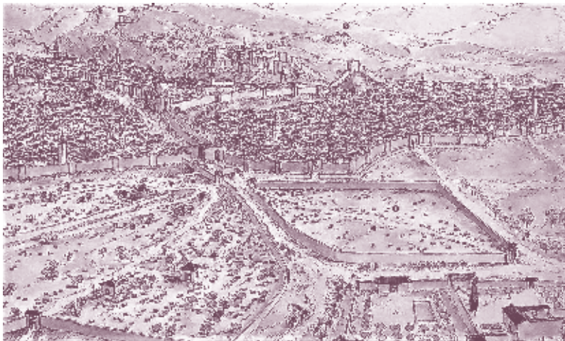
■ Foto 1.8. El dibujo de Granada en el siglo XIV, realizado por Miguel Sobrino para el libro En busca de la Granada Andalusí de Castilla Brazales y Orihuela Uzal, nos da una idea de cómo sería el área que nos ocupa al final de la Edad Media.