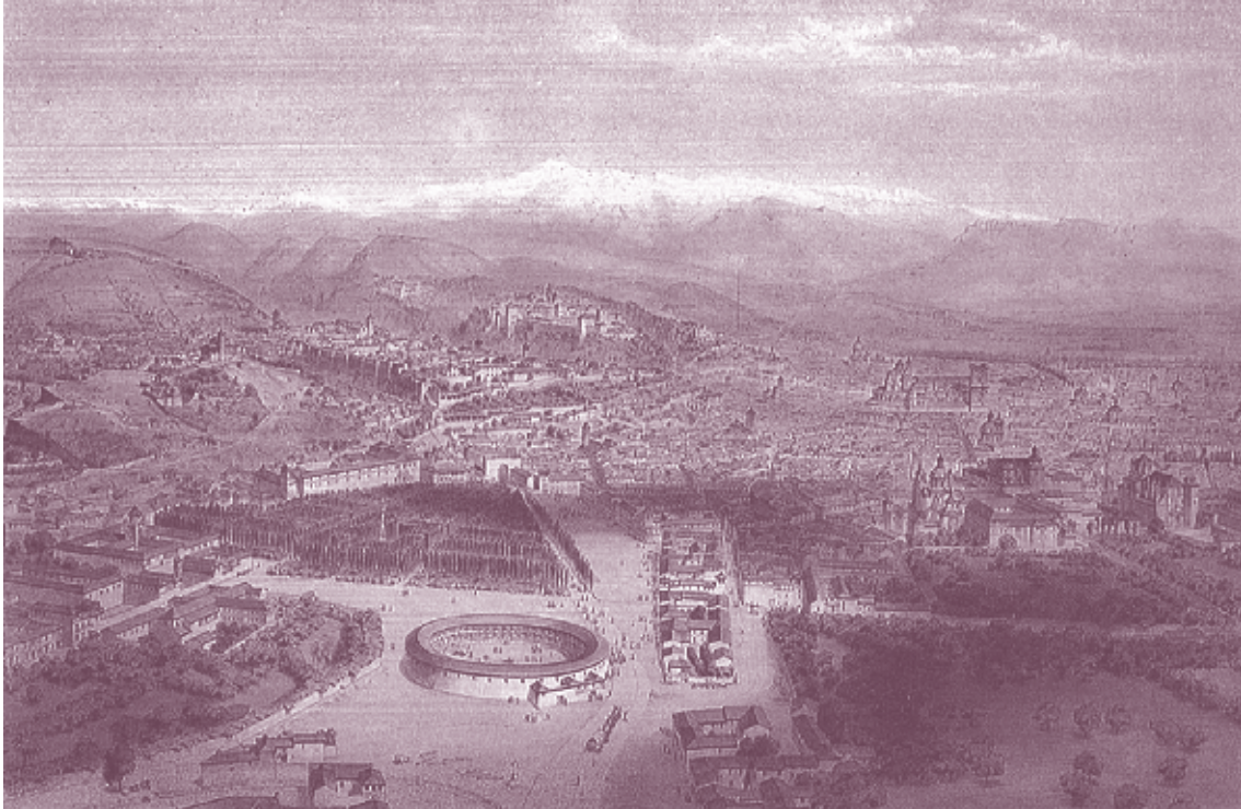
■ Foto 1.9. El grabado de Alfred Guesdon, posiblemente basado en una fotografía tomada desde un globo o aerostato por Charles Clifford en 1859, nos permite imaginar el mismo lugar en el siglo XIX.

era el 26 de mayo de 1831. Fue enterrada en el cementerio de Almengor, habilitado en los primeros años del siglo XIX para hacer frente a la demanda de enterramientos para las víctimas de las epidemias. En definitiva, las notaciones de justicia, ajusticiados y ejecuciones son continuas para este pago durante años. Así fueron las entradas de las ciudades durante muchos siglos (Foto 1.9).