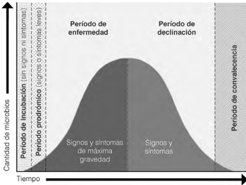
FIGURA 1. Representación de las 3 fases de la enfermedad infecciosa.