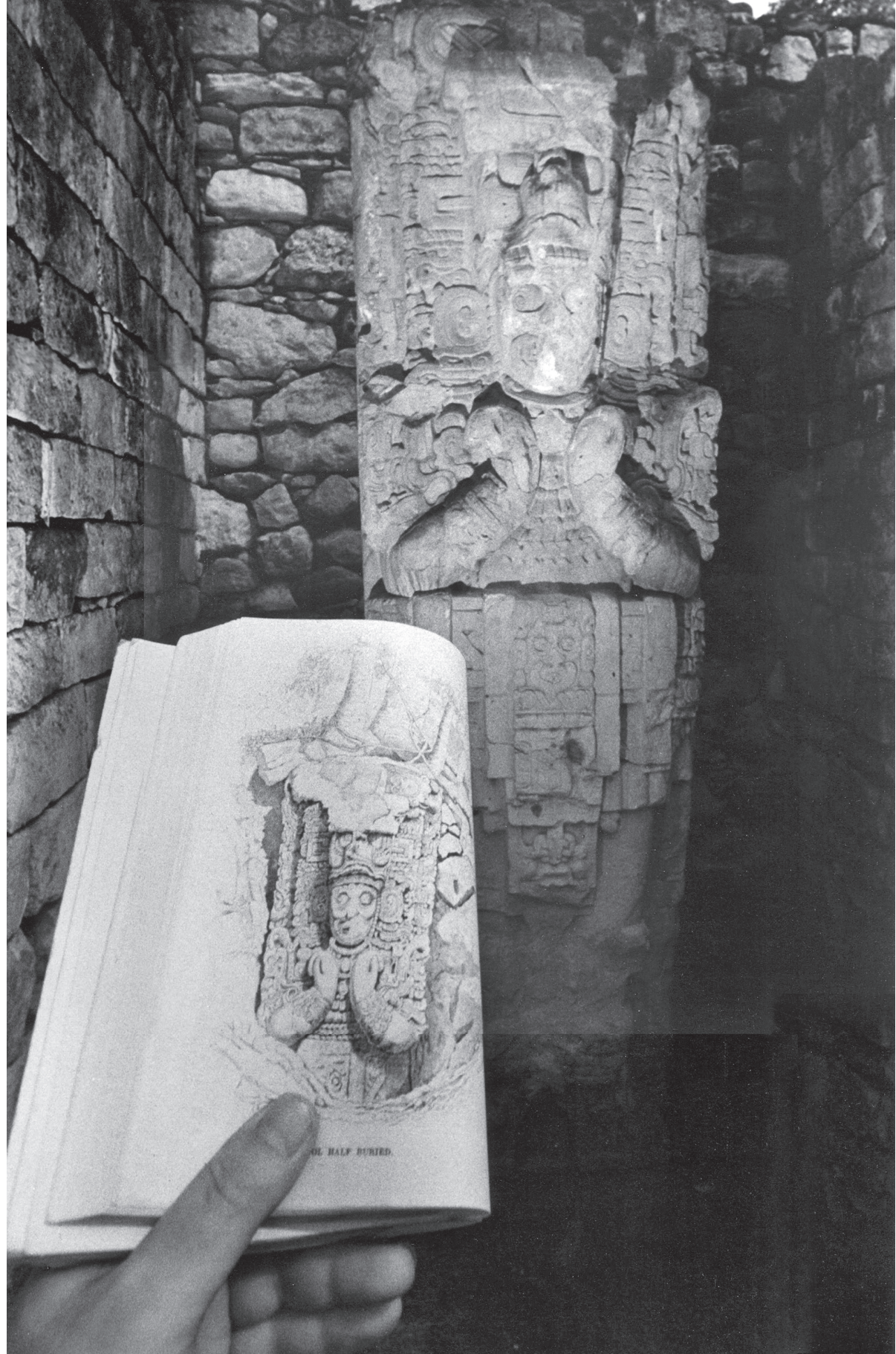
OL HALF BURIED.